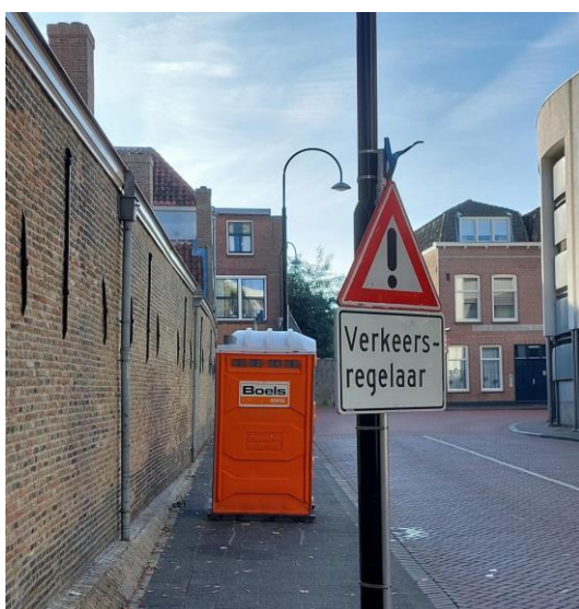
Figuur 4: Dixies zijn nodig tijdens verbouwingen, alleen kunnen ze ook voor ontoegankelijkheid zorgen