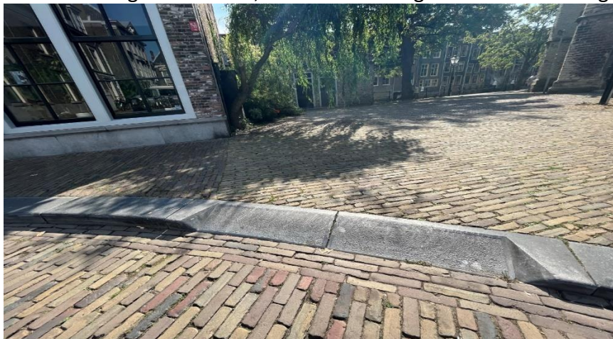
Figuur 3: Het betreffende opritje op de hoek van de Grotekerksbuurt/Pottenkade

Het lukt niet om bij de Lange Gelderse kade over de stoep te gaan, over het Maartensgat en de Mazelaarsbrug kan nu niet, omdat die brug nog stuk is. Door de Synodestraat en de Pottenkade zou je denken, maar dat kan niet omdat je bij het opritje op de hoek Grotekerksbuurt/Pottenkade de stoep niet op kan. Dit zorgt ervoor dat een rolstoelgebruiker moet omrijden via de Grotekerksbuurt > Groenmarkt > Visbrug > Voorstraat als deze naar de andere kant van de Leuvebrug wil. Als de hekken op de Lange Gelderse kade anders neergezet worden, kan een rolstoelgebruiker er wel langs.