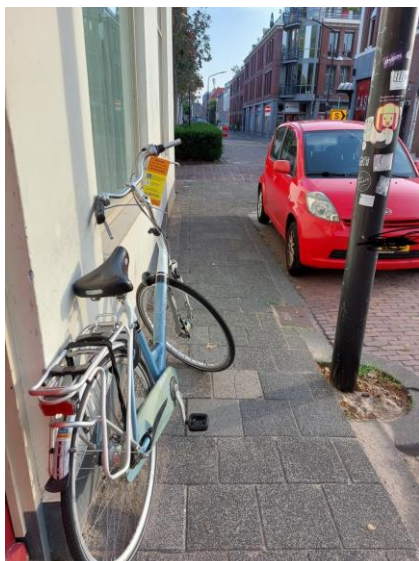
Figuur 1: Een voorbeeld van hoe toegankelijkheid een gezamenlijke verantwoording is geworden

In de bewustwordingscampagne kunnen ludieke filmpjes gemaakt worden waarin mensen met een beperking 'aanlopen en aanrijden' tegen ontoegankelijkheid. Denk aan een rolstoelgebruiker die een stuk moet omrijden omdat die de stoep niet af kan, of aan een slechtziend persoon die tegen een reclamebord oploopt. De slogan van deze campagne is, wat ons betreft: "Een toegankelijke openbare ruimte? Samen zorgen wij ervoor!"