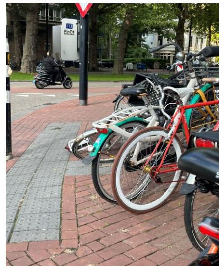
Figuur 2: Deze fietsenstalling blokkeert de geleidelijn. Dat zou niet moeten mogen.

We begrijpen dat er in het historische centrum geen asfaltbaan gelegd wordt (hoewel dat wel lekker rijdt met je rolstoel). Maak de straten wel zo toegankelijk mogelijk, denk aan afgevlakte kinderkopjes die nu in de Grotekerksbuurt liggen, dat scheelt al een heel stuk. De afgevlakte kinderkopjes schokken veel minder dan de oude variant. De op-/afritjes aan de Groenmarkt en de Grotekerksbuurt zijn erg steil waardoor je er geen veilig gebruik van kan maken. Als goed voorbeeld willen we Bergen op Zoom noemen. Ook hier is een historische binnenstad. Daar zijn historisch uitzierende op-/afritten die goed te gebruiken zijn. Ook hier zijn kinderkopjes in verwerkt, maar die zijn wel goed te gebruiken.